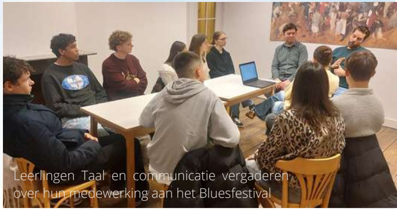
Leerlingen Taal en communicatie vergaderen over hun medewerking aan het Bluesfestival