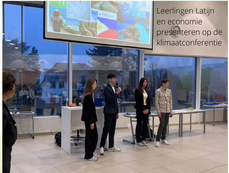
Leerlingen Latijn en economie presenteren op de klimaatconferentie