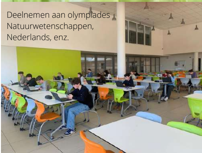
Deelnemen aan olympiades Natuurwetenschappen, Nederlands, enz.