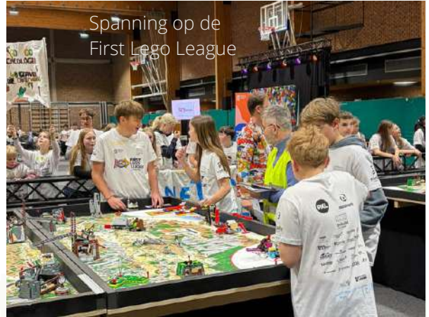
Spanning op de First Lego League