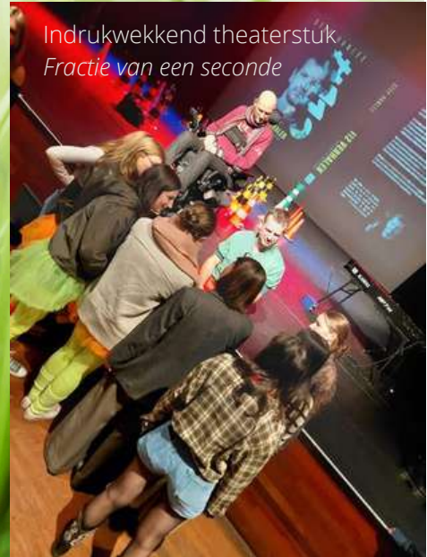
Indrukwekkend theaterstuk Fractie van een seconde