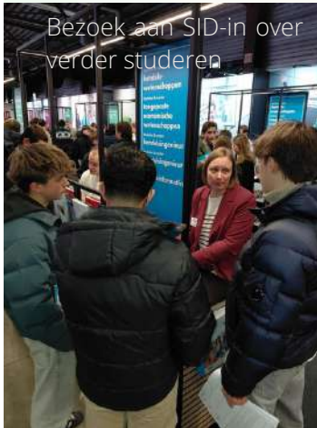
Bezoek aan SID-in over verder studeren