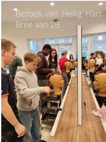
Bezoek van Heilig Hart Bree aan 2B