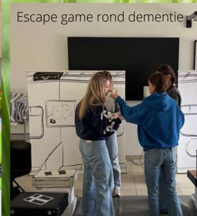
Escape game rond dementie