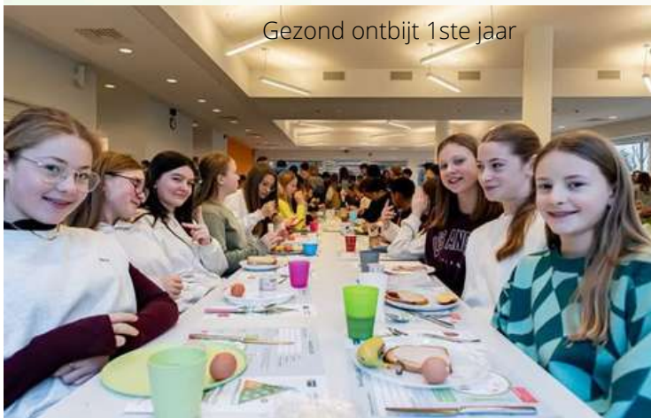
Gezond ontbijt 1ste jaar