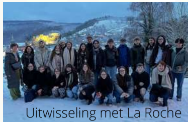
Uitwisseling met La Roche