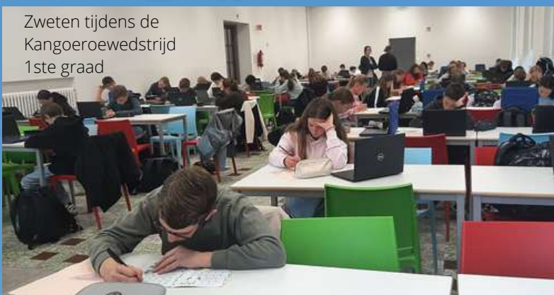
Zweten tijdens de Kangoeroewedstrijd 1ste graad