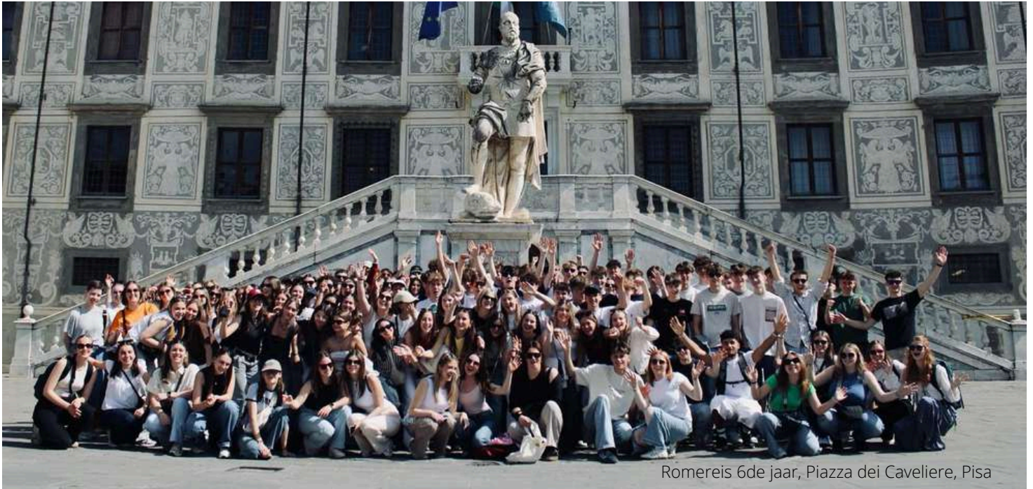
Romereis 6de jaar, Piazza dei Cavaliere, Pisa