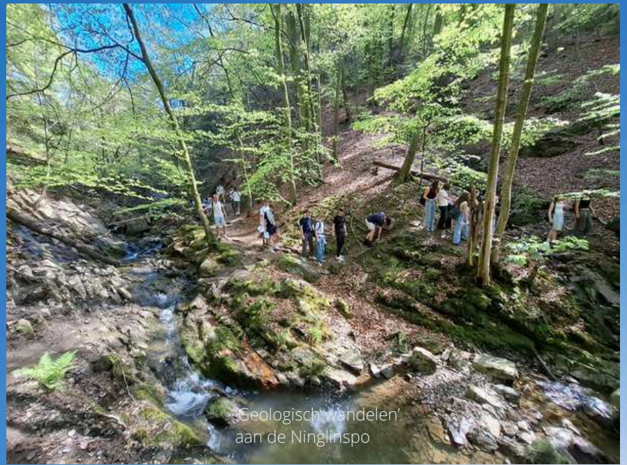
'Geologisch wandelen' aan de Ninglingpo