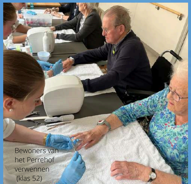
Bewoners van het Perrehof verwennen (klas 52)