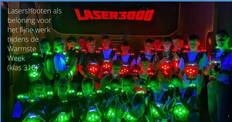
Lasershooten als beloning voor het fijne werk tijdens de Warmste Week (klas 310)