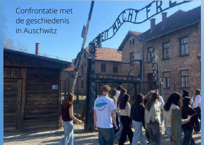
Confrontatie met de geschiedenis in Auschwitz