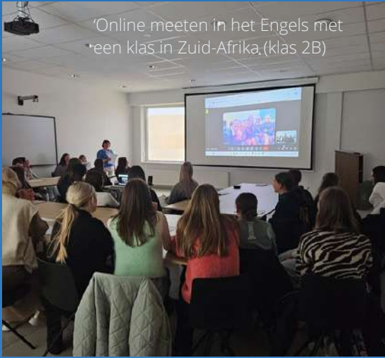
'Online meeten in het Engels met een klas in Zuid-Afrika (klas 2B)