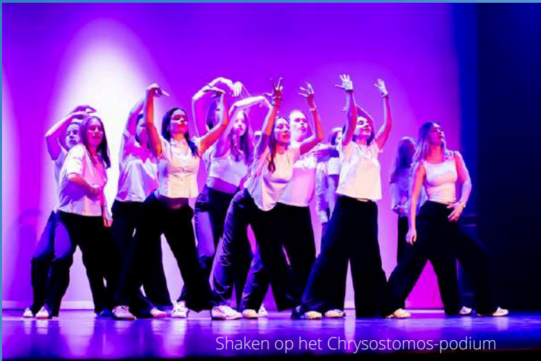
Shaken op het Chrysostomos-podium