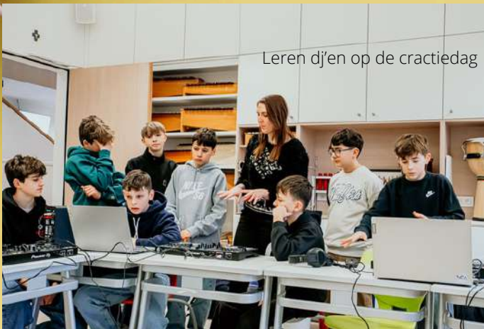
Leren d'jen op de cractiedag