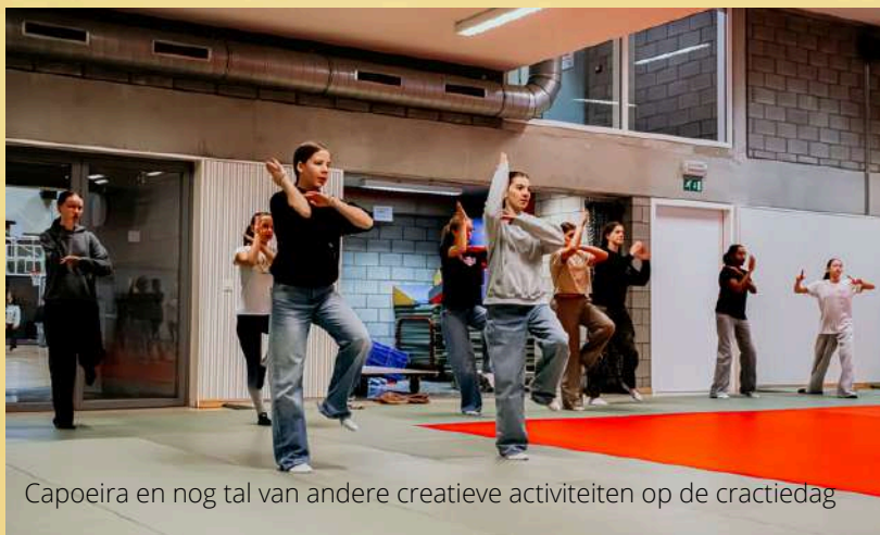
Capoeira en nog tal van andere creatieve activiteiten op de cractiedag