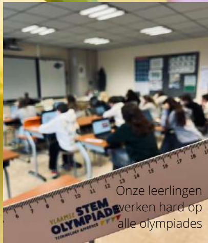
Onze leerlingen werken hard op alle olympiades