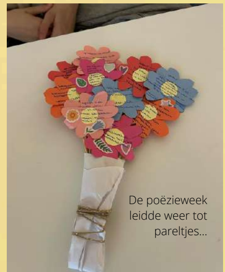
De poëzieweek leidde weer tot paretjes...