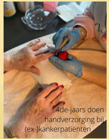
4de-jaars doen handverzorging bij (ex-)kankerpatiënten