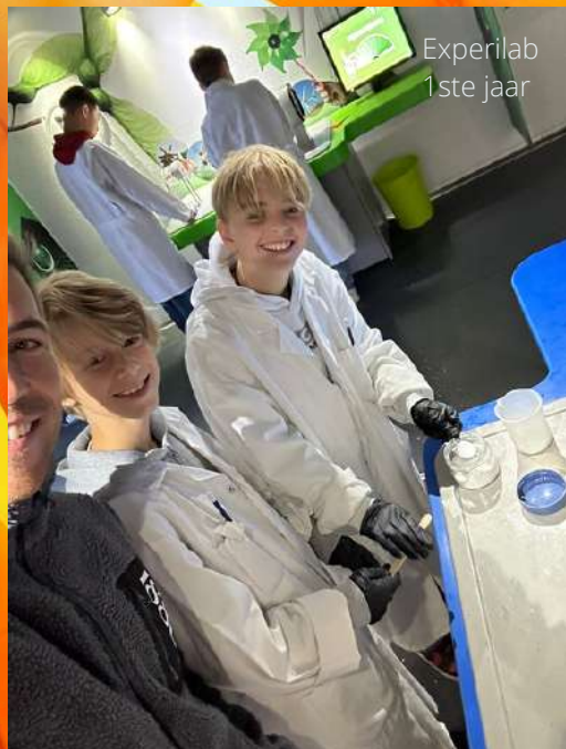
Experilab 1ste jaar