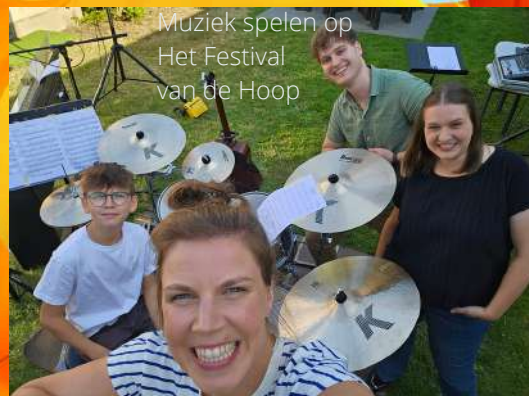
Muziek spelen op Het Festival van de Hoop