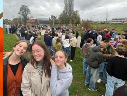
Iedereen veilig en snel geëvacueerd tijdens de jaarlijkse oefening