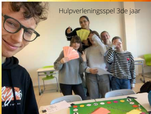
Hulpverleningsspel 3de jaar