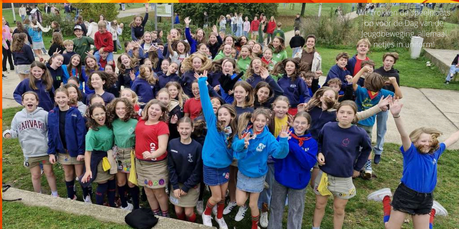
We trokken de speelplaats op voor de Dag van de Jeugdbeweging, allemaal netjes in uniform!