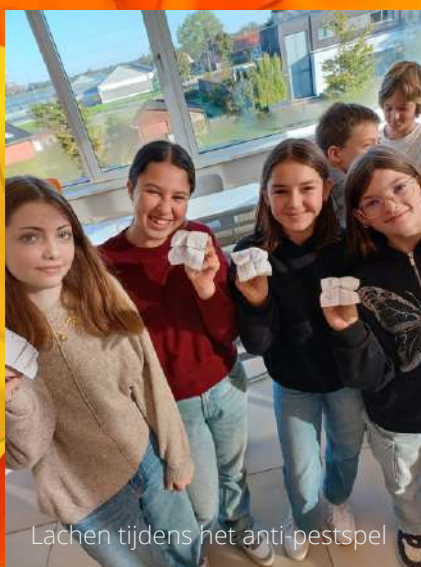
Lachen tijdens het anti-pestspel